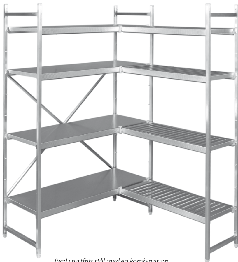
Reol i rustfritt stål med en kombinasjon av platehyller og risthyller