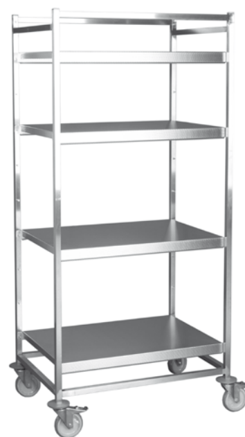
Vogn i rustfritt stål.