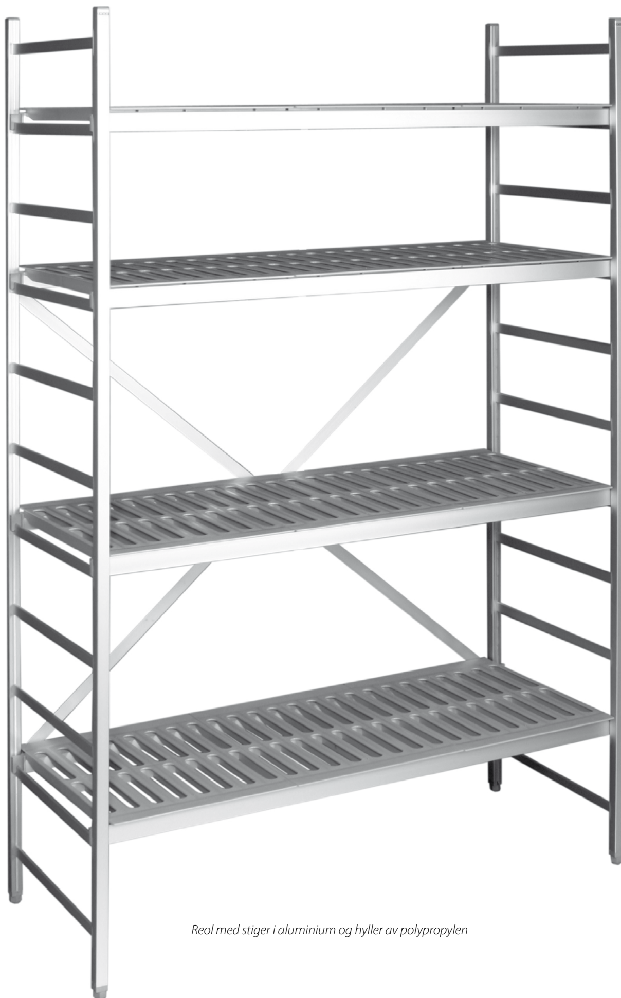
Reol med stiger i aluminium og hyller av polypropylen