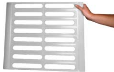
Plasthyllene er lette å ta av og kan vaskes i oppvaskmaskin

Kvadratmeterprisen er ofte høy i kjøle- og fryserom, kjøkkener, sterile rom osv. Plassen kan være knapp, med behov for høy arealutnyttelse. Alminor tilbyr et stort standard leveringsprogram med moduler på 10 cm fra 80 til 150 cm hyllelengder, fire dybder og tre høyder, som gir god økonomisk arealutnyttelse. Hyllene kan monteres i valgfri høyde med intervall på 16 cm.