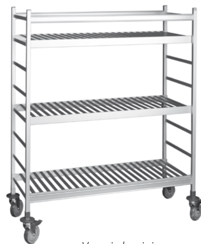
Vogn i aluminium