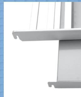
Hyller i aluminium

Renhold koster penger. Alminor System 150 / 250 er utviklet for å møte stadig høyere krav til hygiene og renhold. Produktene har jevne, godt tilgjengelige overflater og lukkede profiler som gjør det enkelt å holde en høy hygienisk standard uten unødig bruk av kostbar tid. Plasthyllene kan enkelt demonteres og vaskes i oppvaskmaskin.