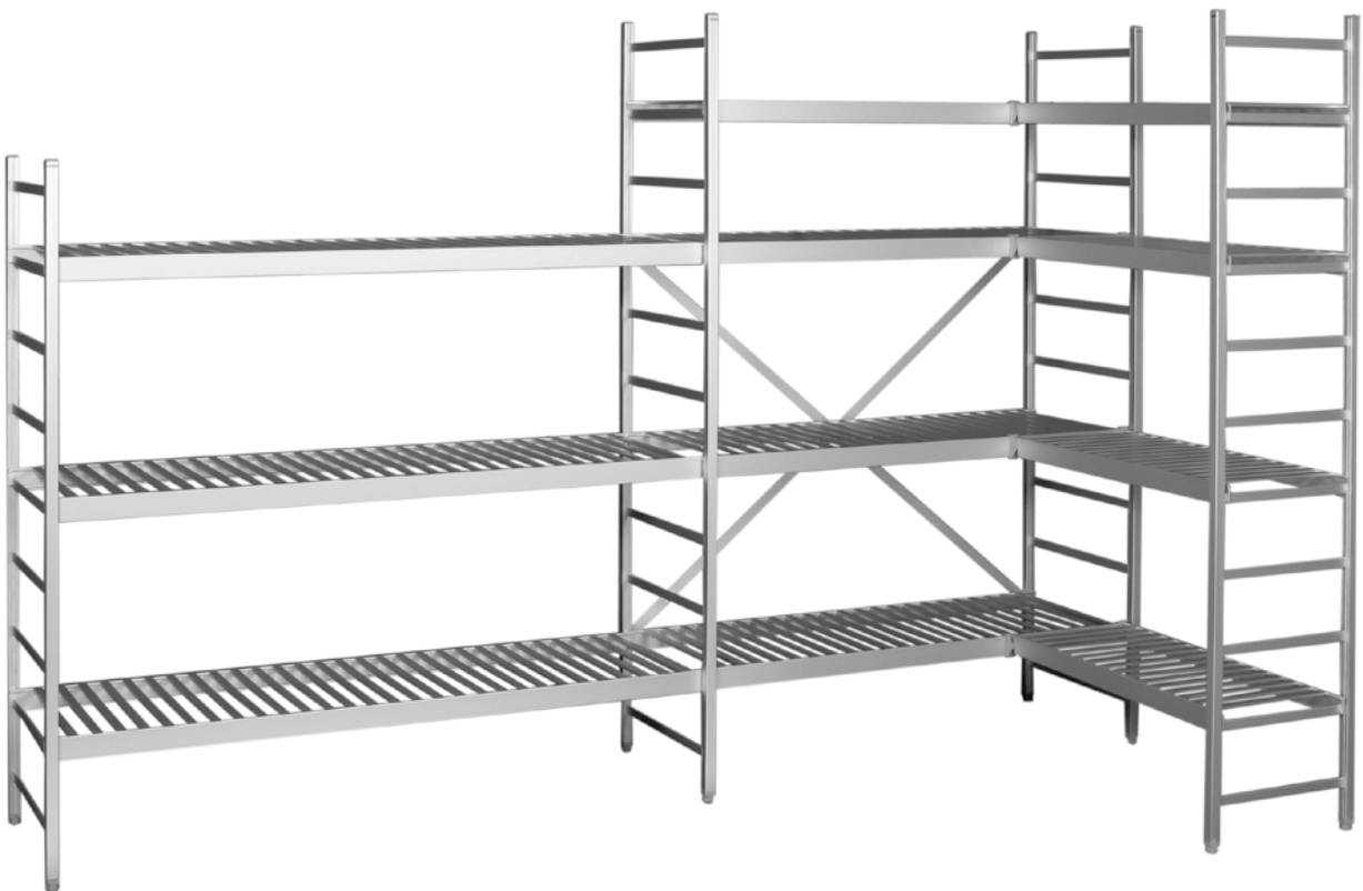
Reol i aluminium m/risthyller