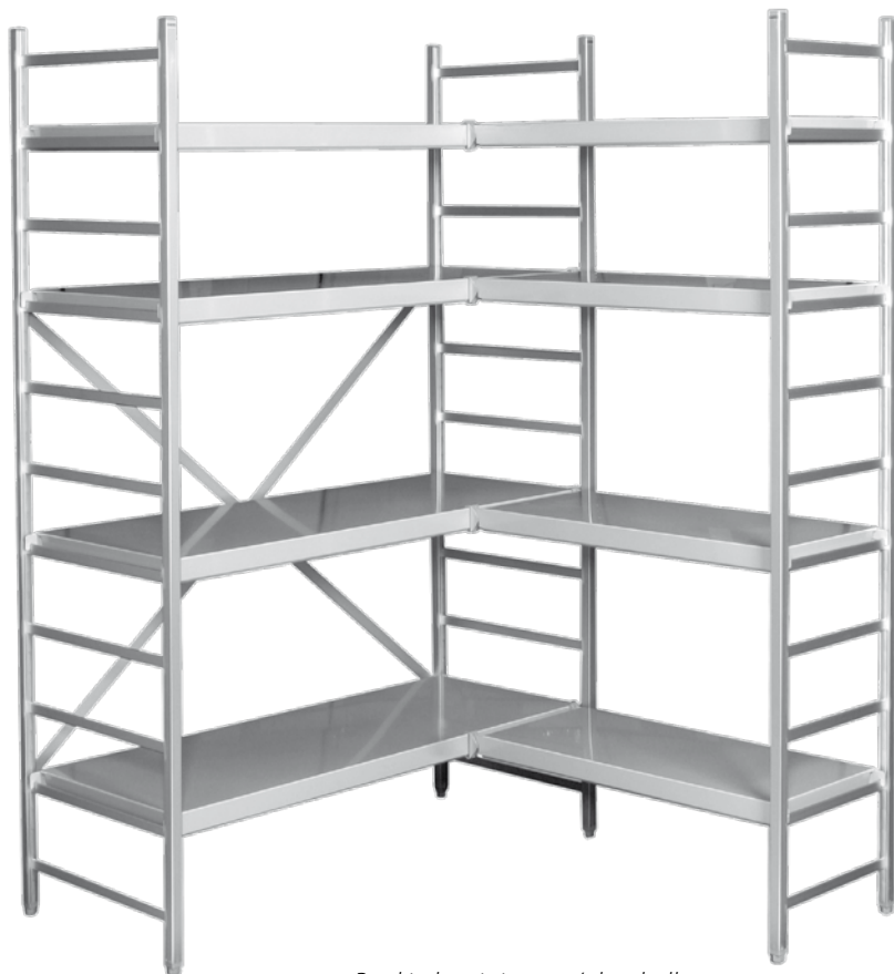
Reol i aluminium m/platehyller